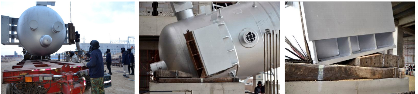
图2 底座标高调整装置、楔形枕木安装

由于高加底座为长方形,以高加底座一侧为转轴旋转时,超过一定角度重心就会偏向另一端,为了防止高加突然加速竖立,形成冲击力,根据计算特设计楔形枕木,在重心与转轴在一条垂直线时,用楔形枕木接住,保证高加平稳竖立。